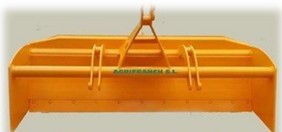
NIVELADORA DE DOBLE HOJA DE 2 MTS DE CORTE

Fabricamos desde 1.50 hasta 3 metros para tractores con potencias que van desde 40 hasta 250 C.V.